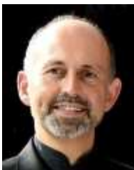
Benjamin Lack Domkapellmeister (DKM)